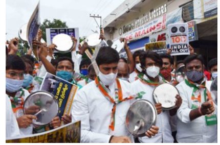
HYDERABAD, JUNE 11 (UNI):- Youth congress activists raising slogans during a demonstration in front of a petrol pump in protest against the raising price of Petrol and Diesel at Vidya Nagar, in Hyderabad on Friday.